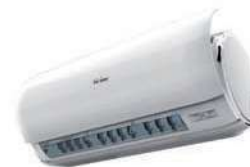
pannello motorizzato APERTO: H 370 x P 263 (mm) CHIUSO: H 318 x P 212 (mm)